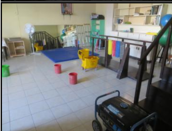
Le service de réadaptation, (endommagé photo du haut – réhabilité photo du bas)

Ce travail de rééducation doit être effectué dès maintenant auprès des personnes ayant subi des blessures importantes. Il y a des personnes blessées à la colonne vertébrale par la chute d'arbres ou de pans de murs ou des personnes souffrant de fractures complexes... Si ces personnes ne bénéficient pas des soins nécessaires, elles ont de fortes chances de développer des handicaps permanents. C'est pour cela que nous avons rééquipé le service de réadaptation de l'hôpital public de Tacloban que le typhon avait presque entièrement détruit (photos à gauche).