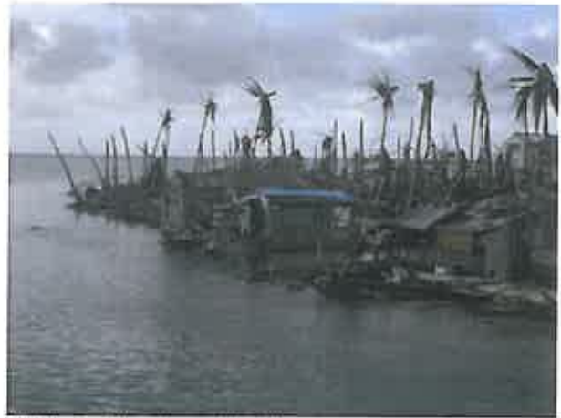
Etat de la côte sud ouest du village