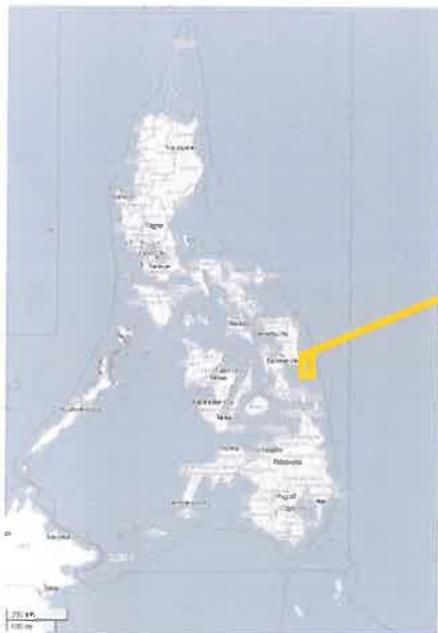
République des Philippines

République des Philippines - Archipel Oriental des Visayas - Ile de Samar - Province de Samar Est - Municipalité de Guiuan - Barangay (village) de Sulangan