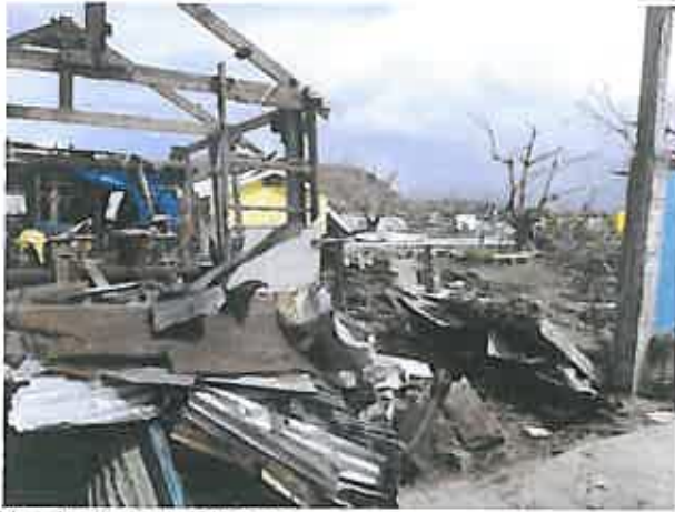
Vue du village de Sulangan