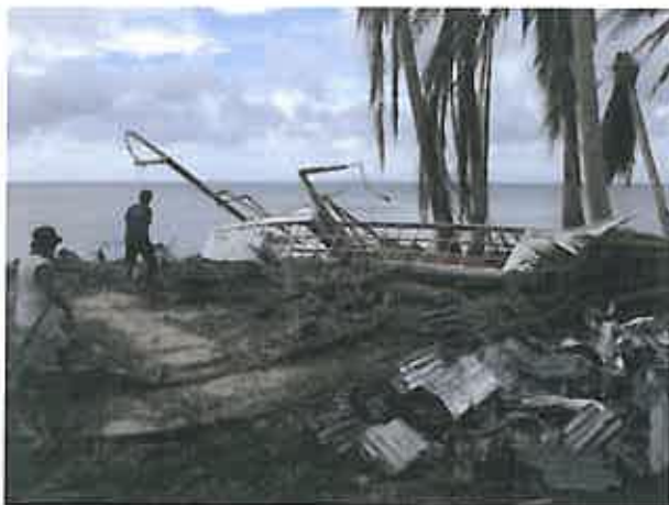
Epave d'un bigboat