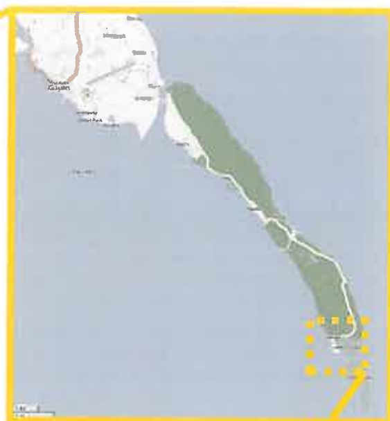
Municipalité de Guiuan