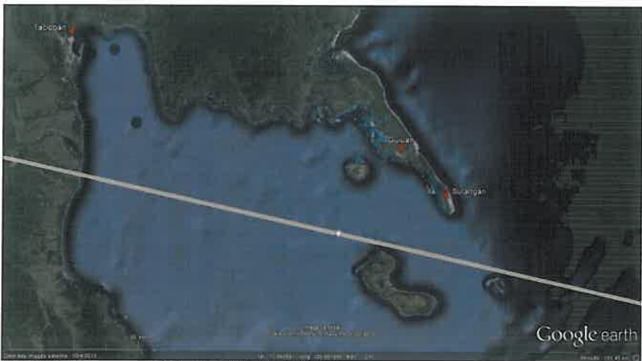
Photo satellite de la zone avec tracé de la trajectoire de l'œil du cyclone