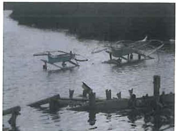
Un baloto (premier plan) et un bamboat (second plan) rescapés de la tempête