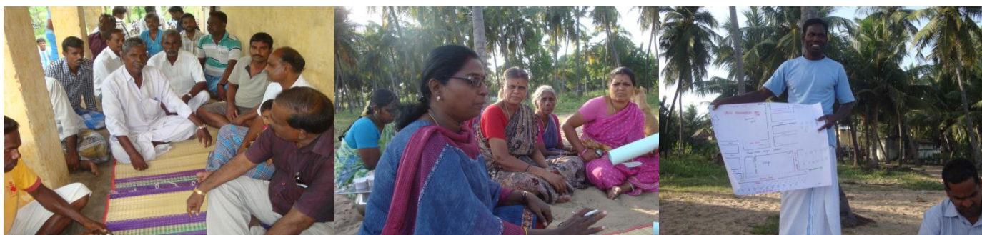
Une approche concertée et participative de la population locale à Chinna Veerampattinam pour choisir les priorités du village

Ce travail a permis d'avoir une vision plus complète du village, ainsi que d'identifier les points forts et les points faibles du projet et déceler les menaces ainsi que les opportunités.