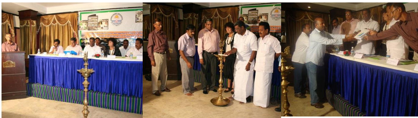
Le séminaire d'échange de bonnes pratiques auquel ont participé deux ministres du gouvernement de l'Union territoriale de Pondichéry et lors duquel l'étude sur les enjeux de la gestion intégrée des zones côtières leur a été remise