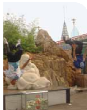
► Projet "hip hop", juillet 2009.

La Ville de Rennes favorise l'ouverture internationale des Rennais, contribue à l'affirmation de la métropole rennaise en Europe et au-delà et participe à la construction d'un monde plus solidaire. En signant un accord de jumelage en juillet 2002 avec Jinan, l'objectif était de donner à tous les acteurs de notre ville la possibilité de nouer des relations avec la Chine. Depuis, la mobilisation, favorisée par le comité de jumelage, est exemplaire. Elle a valu à Rennes d'obtenir en 2010 « l'oscar de la coopération » décerné par l'association du peuple chinois pour l'amitié avec les peuples.