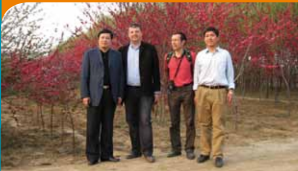
► La Direction des jardins de Rennes en mission à Jinan.

Le "jardin de Rennes" à Jinan marque la présence de Rennes au sein d'un parc de 345 hectares. Il est né en 2010 d'un travail collaboratif entre les directions des jardins de Rennes et de Jinan. Un partenariat qui a permis des échanges de savoir-faire sur la conception et la mise en œuvre d'aménagements paysagers. Afin de faire découvrir aux Rennais ce jardin du bout du monde et l'influence chinoise dans le jardin du Thabor, l'exposition « Eau et jardins à Jinan » a été présentée à l'Orangerie du Thabor en octobre 2010.