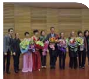
► Mission du Conservatoire à rayonnement régional de Rennes à Jinan, novembre 2011.