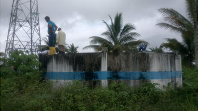
Réservoir à Daule