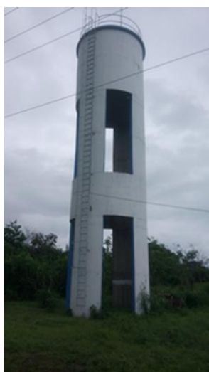
Nouvelle usine de traitement d'eau